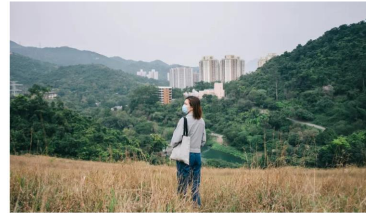
Souhaitons-nous trouver le cadre de vie urbain pour la tranquillité de la campagne ?