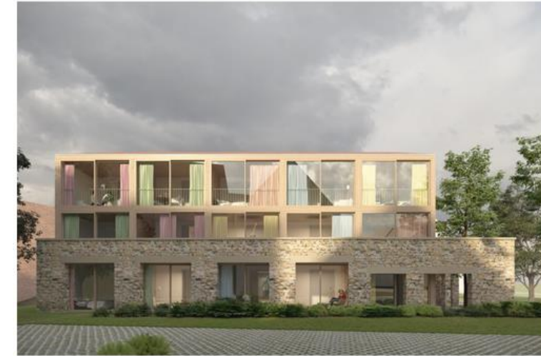
Siewiller concours d'idées (2018)